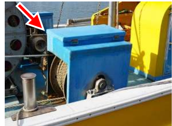
ワープ（曳網）ウィンチに設置したカバーの例