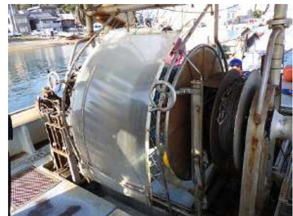
ネットウィンチに設置したカバーの例