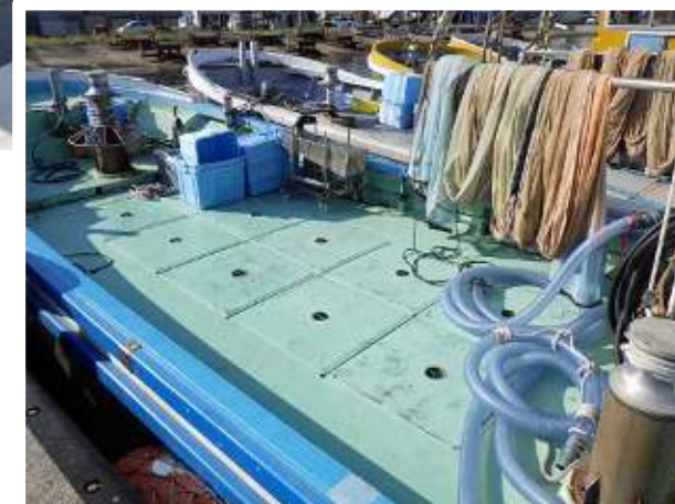
段差の少ない甲板の例

転倒は漁船上でもっとも頻繁に起こる労働災害のひとつです。 しっかり対策をして転倒災害を未然に防ぎましょう。